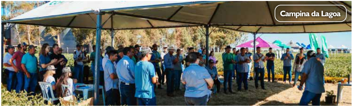
Campina da Lagoa

Essa descentralização dos Dias de Campo reforça o compromisso da Coagru com a inovação e o desenvolvimento sustentável das lavouras, proporcionando conhecimento técnico de forma prática e acessível aos seus associados.